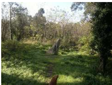
Sentier du Menhir