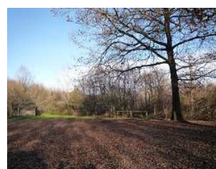
Parking de la maison forestière des Verreries