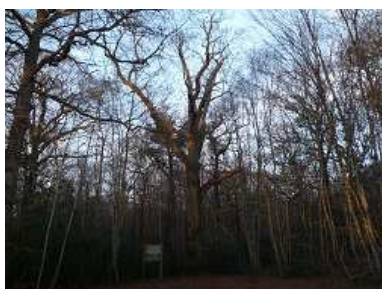
Le Chêne Marinier en hiver