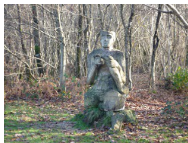
Une partie de l'arbre remarquable