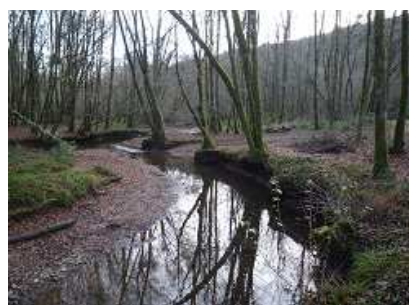
Gué de la Stèle

Précautions : le ruisseau des Verreries peut charrier des branchages.